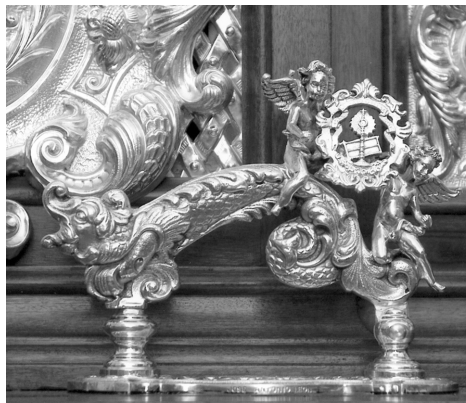
Nuevo llamador en su paso.

Admirados fueron los estrenos del estandarte corporativo, el llamador del paso y la aureola de San José Obrero.