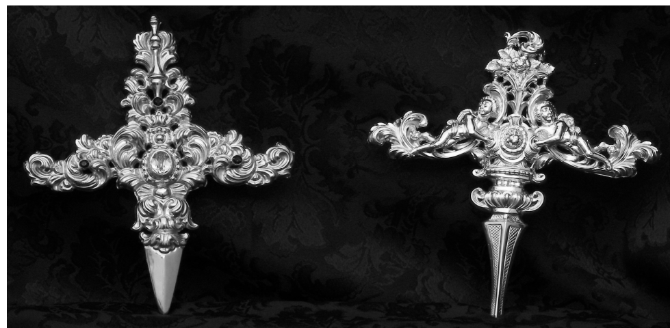
De izquierda a derecha, puñal en plata sobredorada y puñal en plata de ley.