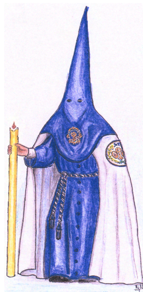
Boceto por Miguel Ángel Alonso

Se convoca a todos los hermanos y hermanas interesados, a la reunión informativa que tendrá lugar el próximo día 18 de mayo a las 20:45 horas en los salones parroquiales. En la misma se dará cuenta de los pormenores relacionados con el hábito nazareno, métodos y facilidades posibles para su adquisición, así como serán atendidas las posibles dudas o cuestiones que puedan surgir.