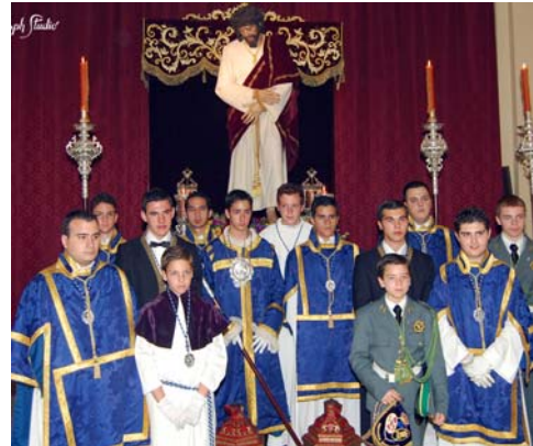
Cuerpo de Acólitos tras el Piadoso Via Crucis.