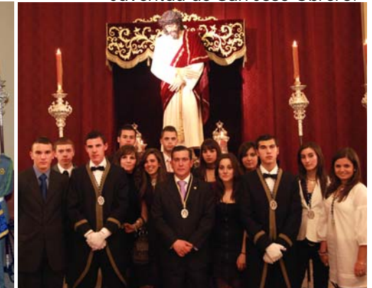
Varios miembros del Grupo Joven junto a nuestro Hermano Mayor.