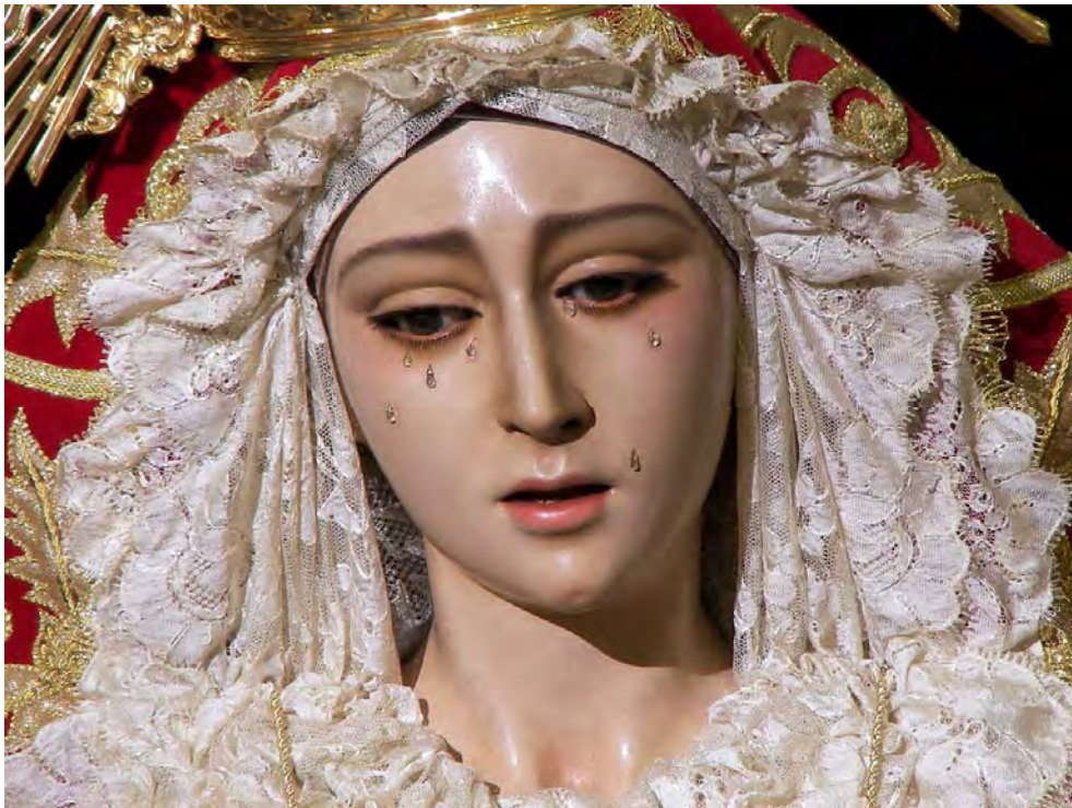
Nuestra Señora de los Dolores en el Besamanos de septiembre de 2007.

Son muchos los aspectos y detalles a tener en cuenta de cara a una salida procesional, y nuestra Hermandad puede dar fe de ello. Pero ésta, además, viene impregnada de sentimientos muy especiales, pues será la primera ocasión (Dios medie) en la que nuestra Hermandad pueda ver materializado este culto a nuestra titular mariana, recogido en nuestras Santas Reglas. Además, sabedores de la devoción que en nuestro barrio se le profesa desde siempre a nuestra Madre de los Dolores, este histórico acontecimiento nos conmina a redoblar esfuerzos, contando con la importante ayuda de los propios vecinos de San José Obrero.