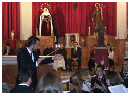
La Banda Ntra. Sra. del Sol en plena interpretación.

El día 2 de marzo, tuvo lugar la presentación del libro "San Francisco de Paula en el Arte Sevillano", obra de varios coautores y que nos acerca primero a la figura histórica del Santo Fundador, para llevarnos después por un revelador recorrido, mostrándonos las numerosas representaciones artísticas que en Sevilla existen de San Francisco de Paula. Sin duda, es un riguroso e interesante documento que viene a llenar un hueco en la bibliografía artística y sevillana.