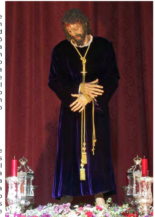
El Señor en sus andas.

Al cierre de la redacción de este boletín prosiguen los cultos cuaresmales que en honor al Señor de la Caridad celebra cada año la Hermandad, desde que la venerada imagen fuera bendecida en aquel histórico día 14 de marzo de 2004. En la próxima edición os contaremos los pormenores de todo lo acontecido.